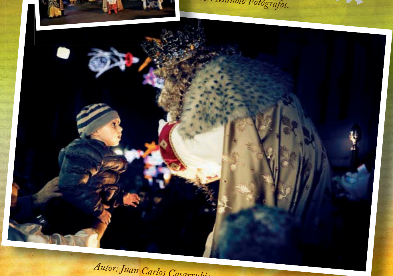
Autor: Juan Carlos Casarrubio