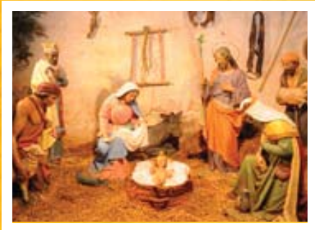
Autor: Paco Crespo

Acompañados por la “Banda del Taller de Música Castell Vermell d’Ibi”. Instalados en la Cueva del Pesebre (en la lonja del Archivo Histórico), en la Sede Social de la Asociación, en la Comisión de Fiestas de Moros y Cristianos y en la Ermita de San Vicente. Acompañando al Exmo. Ayuntamiento de Ibi.